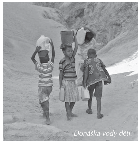
Donáška vody děti.

rické vrstvy nemají milosrdenství v krvi jako samozřejmost.