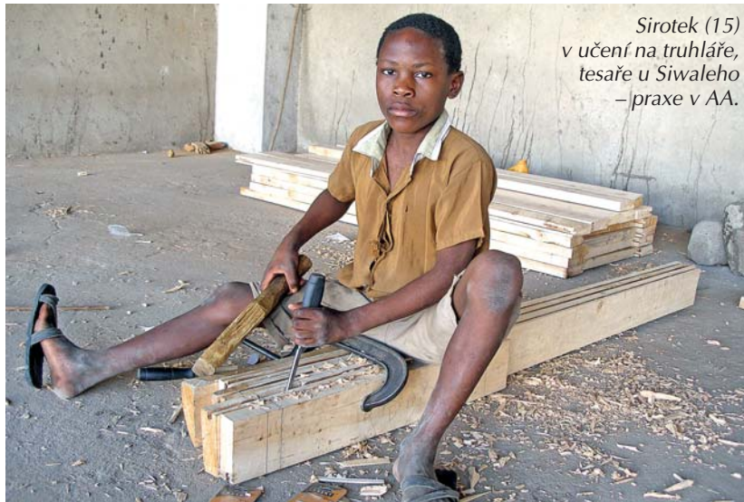
Sirotek (15) v učení na truhláře, tesaře u Siwaleho –praxe v AA.