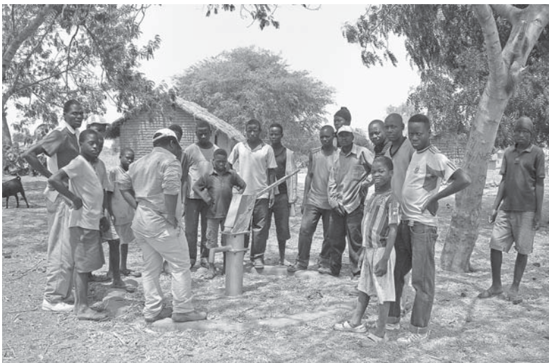
Rokování kolem opravy studny v Mpapa.

Přitom mnozí afričtí podnikatelé často chápou svůj úspěch jako oslavu vlastních výjimečných schopností a ze svého zlatého telete nejsou ochotni ukrojit ani kousek ve prospěch svých spoluobčanů. Dlužno také doplnit, že ani ty nejchudší af-