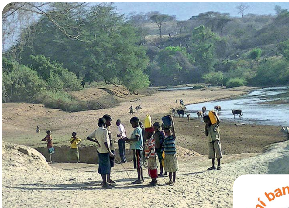
Údolí řeky Momby u vesnice Chilulumo.