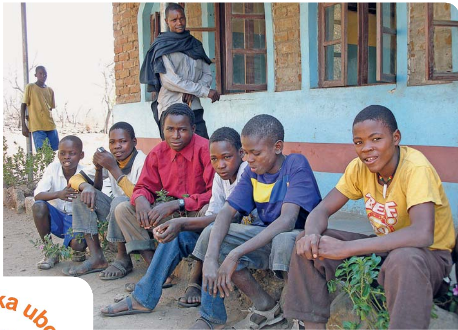
Někteří naši žáci – sirotci před školou v Mwenyemba.