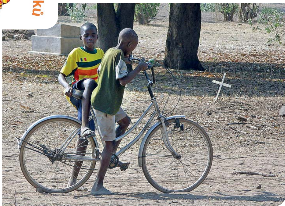
Kamarádi v Chilulumo.