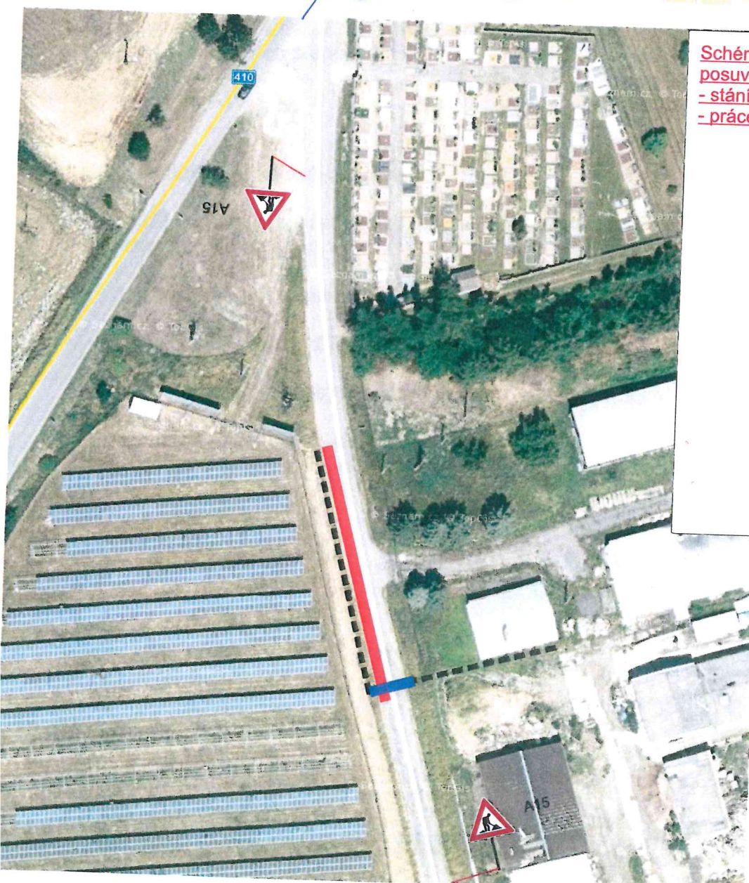
Schéma A: posuvné pracovní místo v délce max. 50 m - stání pracovních vozidel na komunikaci - práce budou probíhat mimo vozovku